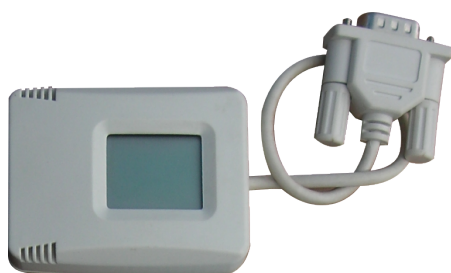
Внешний WEB/SNMP - адаптер - это самостоятельное устройство, совместимое со всеми сериями ИБП, оснащенными портом RS-232.

Встраиваемый мини-адаптер DA 806 оснащен портом для подключения опционального внешнего датчика температуры и влажности NetFeeler USB