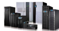
Delta предлагает полную линейку решений ИБП мощностью от 0,6 до 4000 кВА, способных удовлетворить любые потребности в бесперебойном питании