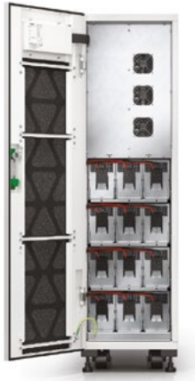
Uniprom UPS 3S, 10 кВА с батареями внутри