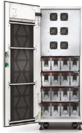
Uniprom UPS 3S, 40 кВА с батареями внутри