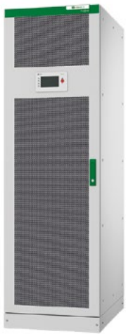
ИБП Uniprom 3L, 400 кВа

ИБП серии Uniprom обеспечивают до 96 % КПД в режиме двойного преобразования и до 99 % — в ECO режиме сохранения энергии благодаря их техническим преимуществам, конкурентоспособным параметрам и устойчивой к воздействиям окружающей среды архитектуре. ИБП предназначены для быстрой и простой установки в электроцеховых или промышленных помещениях, имеют широкий температурный диапазон, надежную защиту от перегрузок, небольшой вес и компактный размер, а также готовы к использованию с системами дистанционного мониторинга. Это делает ИБП серии Uniprom прекрасным выбором для обеспечения непрерывности сервисов вашей компании.