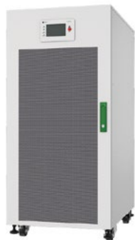
ИБП Uniprom 3M, 200 кВа